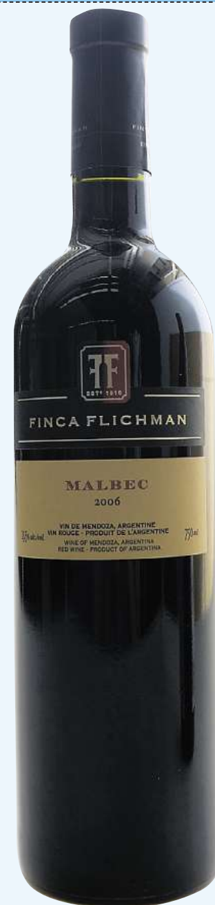
MALBEC FINCA FLICHMAN 2006, MENDOZA, ARGENTINE