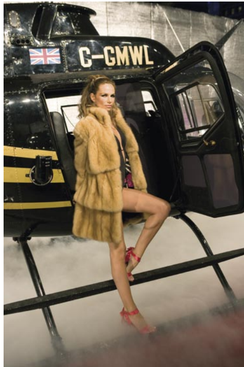
Bond girl and helicopter